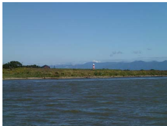
川からの景色を堪能