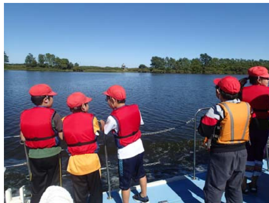
協力してミッションをクリア