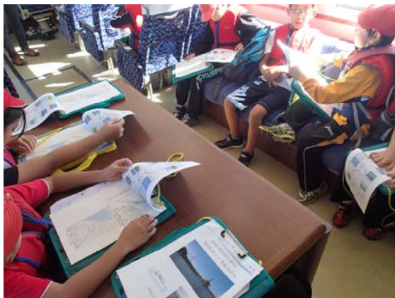
ショートカットについて学びます