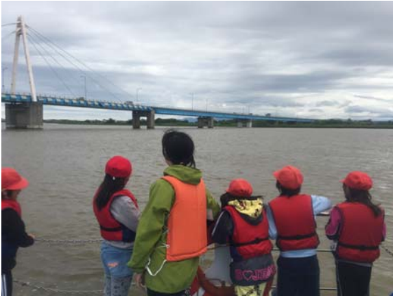
川の水はにごっていました