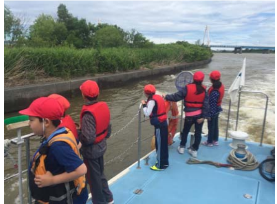
カードのものを見つけたよ！