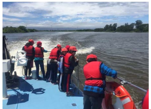
川の上は気持ちいい！