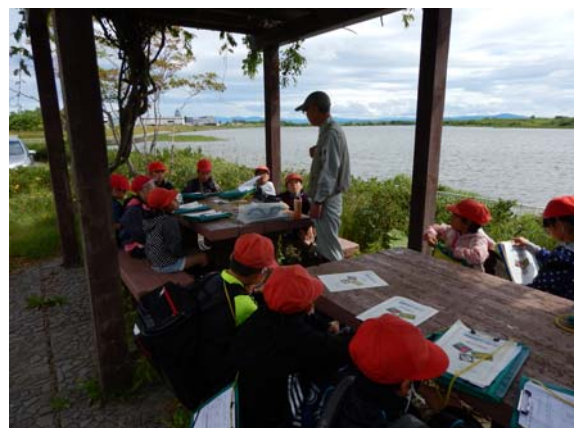
この季節に咲く周辺のお花は？