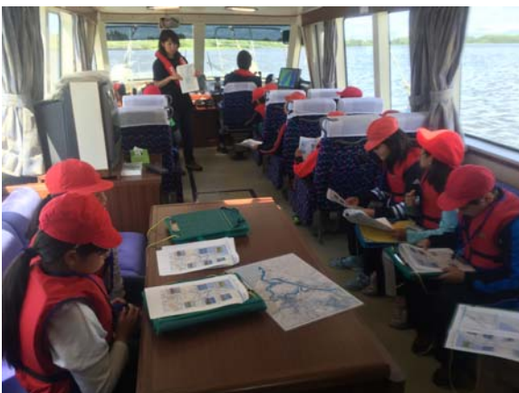
ショートカットについて学びます