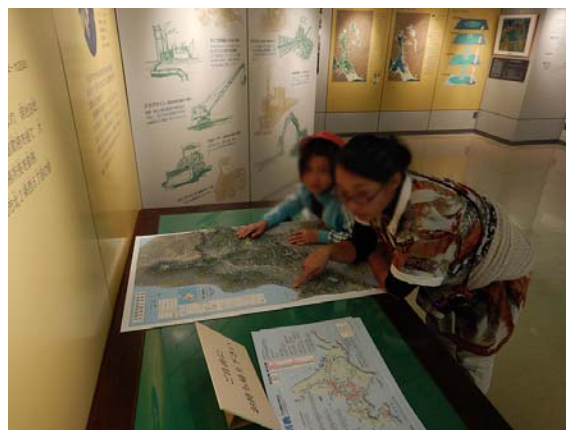
石狩川の流域面積