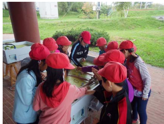
みんなで堤防をつくってみよう