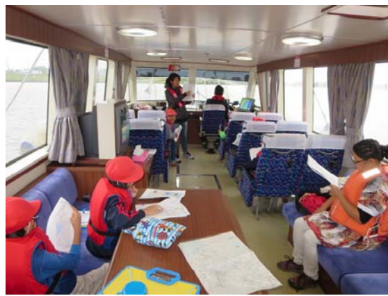
水の大切さについても学びます