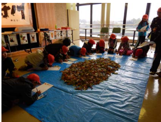
いろいろな形や色の葉っぱがある