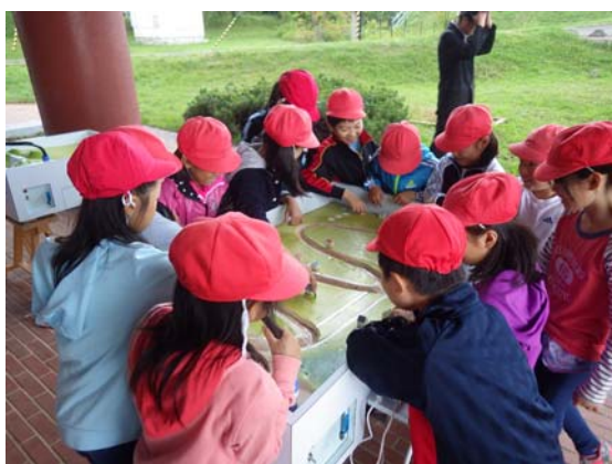
洪水で田畑や家が流される・・・