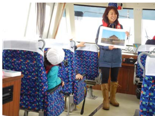
ミッションクリア!!!