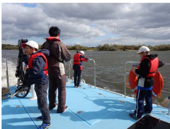
初めて川の上から観察