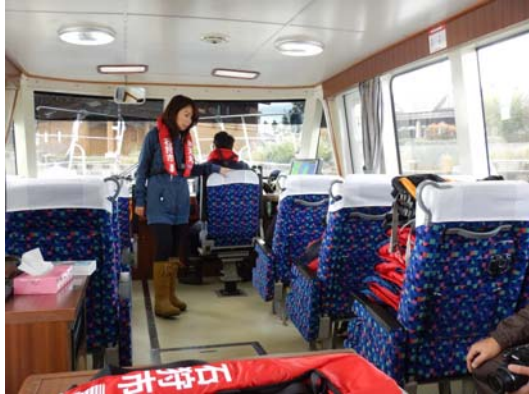
ライフジャケットを着用