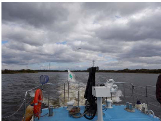
弁天丸は普段川の調査をしています