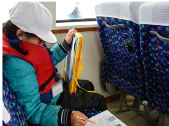
石狩川の治水工事について